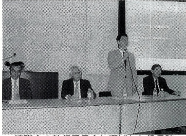
協議会の執行委員会に選ばれた役員陣

アガリクス・フラゼイ協議会の設立発表会が9月22日、東京・有明の東洋ビルグサイトで開催された。発表会では、出席した事業者を前に、同協議会の活動目的、組織概要、安全性